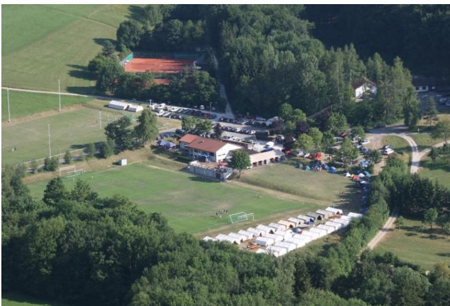
Blick auf das Sportgelände während des Jugendturniers